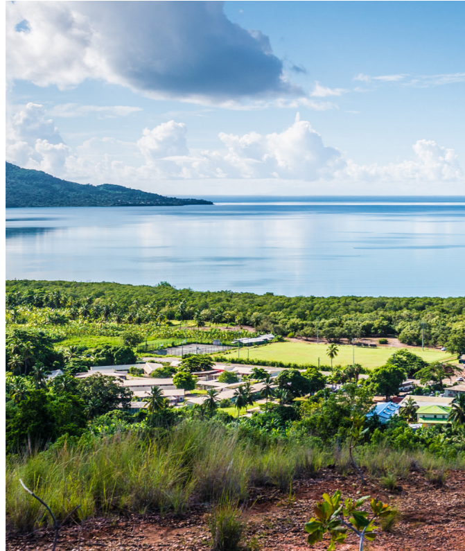
Loin des panoramas idylliques, Mayotte est sujette à des problématiques d'accès à l'eau et aux soins.

L'île de Mayotte, département le plus jeune de France, doit faire face à l'épidémie du Covid sans compter deux autres épidémies signalées. C'est dans ce contexte d'urgence sanitaire que les mathématiciens du Laboratoire Mathématiques et Applications à Poitiers créent des outils de modélisation pour apporter des solutions non pharmaceutiques efficaces.